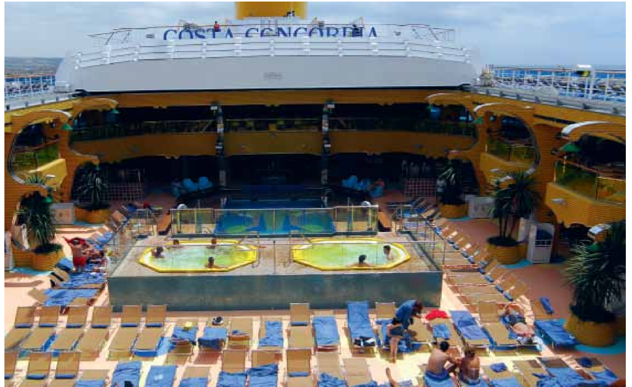
De Costa Concordia in betere tijden, een kruising tussen een drijvende stad en een hysterisch pretpark

Officieel moeten de passagiers binnen 24 uur nadat ze aan boord zijn gegaan