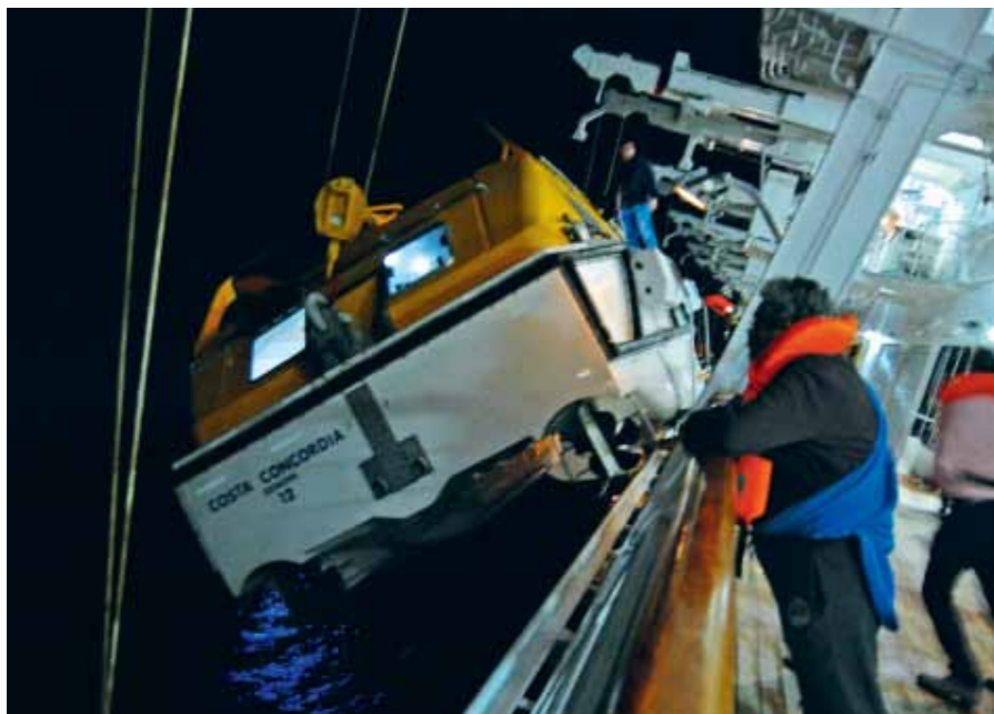
Passagiers op het zinkende schip (boven) en een reddingsloep die te water wordt gelaten