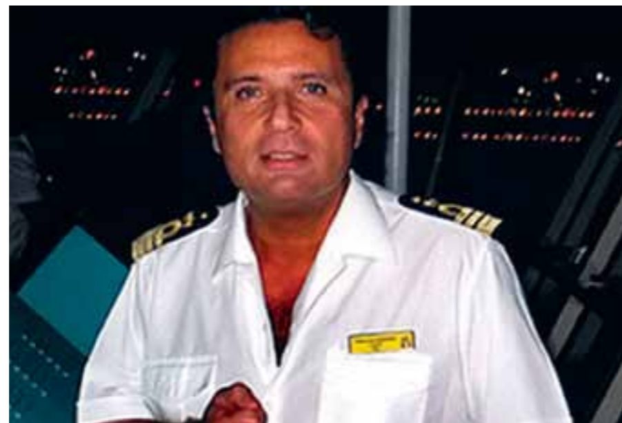
Kapitein Francesco Schettino