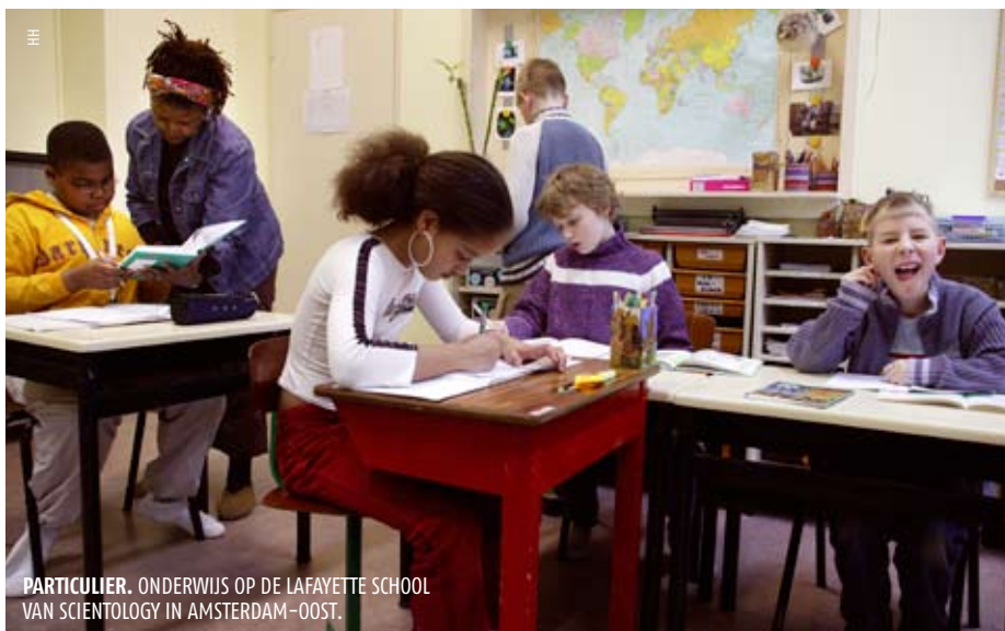
PARTICULIER. ONDERWIJS OP DE LAFAYETTE SCHOOL VAN SCIENTOLOGY IN AMSTERDAM-OOST.

Scientology verspreidt zich in Nederland ook via verschillende adviesbureaus zoals Improved Conditions uit Almere, Silhouet Management met vestigingen in Weesp en Hendrik-Ido-Ambacht