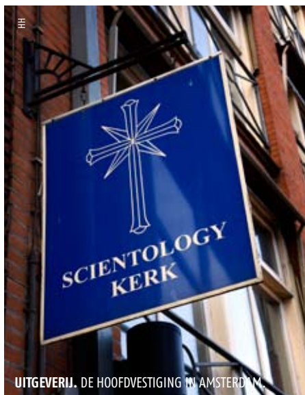
UITGEVERIJ. DE HOOFDVESTIGING IN AMSTERDAM