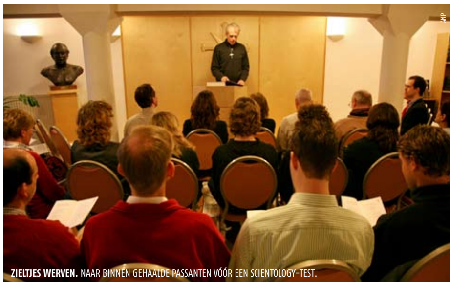
ZIELTJES WERVEN. NAAR BINNEN GEHAALDE PASSANTEN VÓÓR EEN SCIENTOLOGY-TEST.

Blondeel. 'Op welke manier weet ik niet, maar dat zou bijvoorbeeld in studie-uren kunnen zijn.'