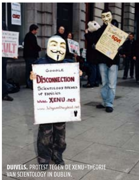
DUIVELS. PROTEST TEGEN DE XENU-THEORIE VAN SCIENTOLOGY IN DUBLIN.

Bijlescentrum Aps aan de Rozengaard 1233 in Lelystad is bijvoorbeeld Stichting Applied Scholastics met een door Hubbard ontwikkelde leermethode. Deze stichting heeft volgens de website ook een vestiging in Bussum en een Studie Centrum voor Individuele Ontplooiing in