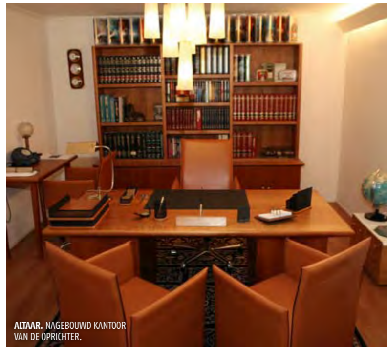
ALTAAR. NAGEBOUWD KANTOOR VAN DE OPRICHTER.