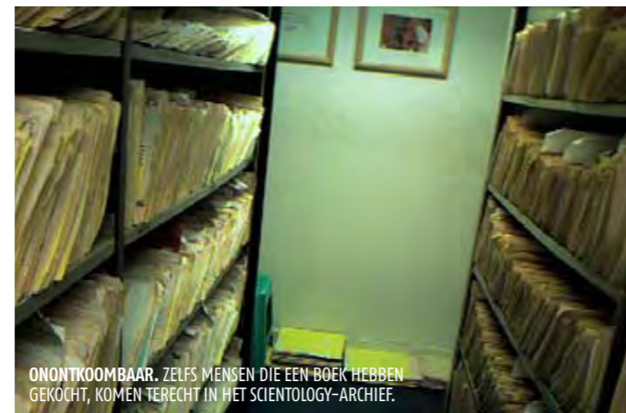
ONONTKOOMBAAR. ZELFS MENSEN DIE EEN BOEK HEBBEN GEKOCHE, KOMEN TERECHT IN HET SCIENTOLOGY-ARCHIEF.