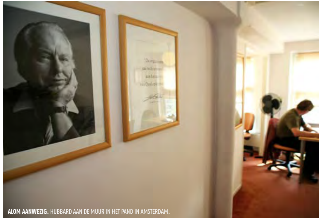
ALOM AANWEZIG. HUBBARD AAN DE MUUR IN HET PAND IN AMSTERDAM.

Scientology wil geen antwoord geven op de door Revu voorgelegde vragen. Zij wil niet 'met het mes op onze keel praten,' laat woordvoerder Julia Rijnvis per e-mail weten. 'Er is een reden dat bepaalde figuren/bladen ongenueanceerd tegen ons aan schoppen, namelijk dat wij bepaalde exposures doen mbt misstanden in de psychiatrie en big farma. Scientology moet dan weggezet worden als een malle sekte met als doel dat onze exposures over de misdaden van voornoemde jongens niet geloofd worden door het grote publiek.'